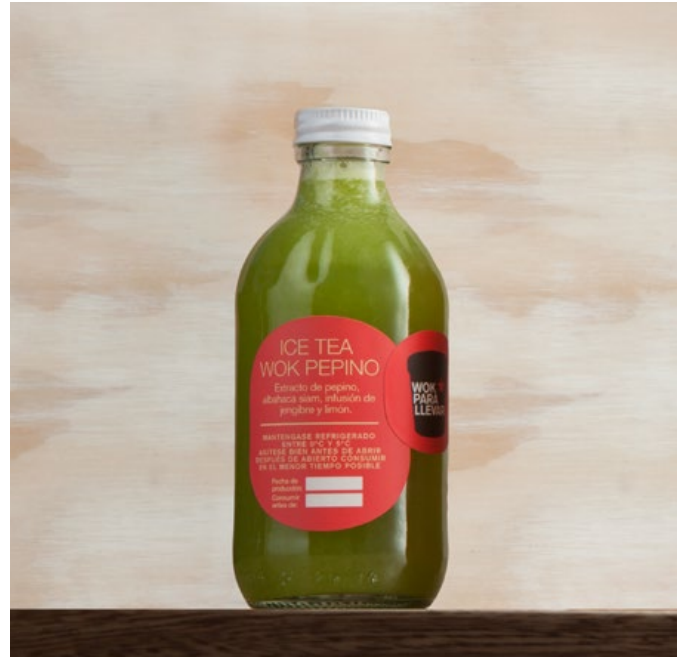
ICE TEA WOK PEPINO Extracto de pepino, albahaca siam, infusión de jengibre y limón. $11.600