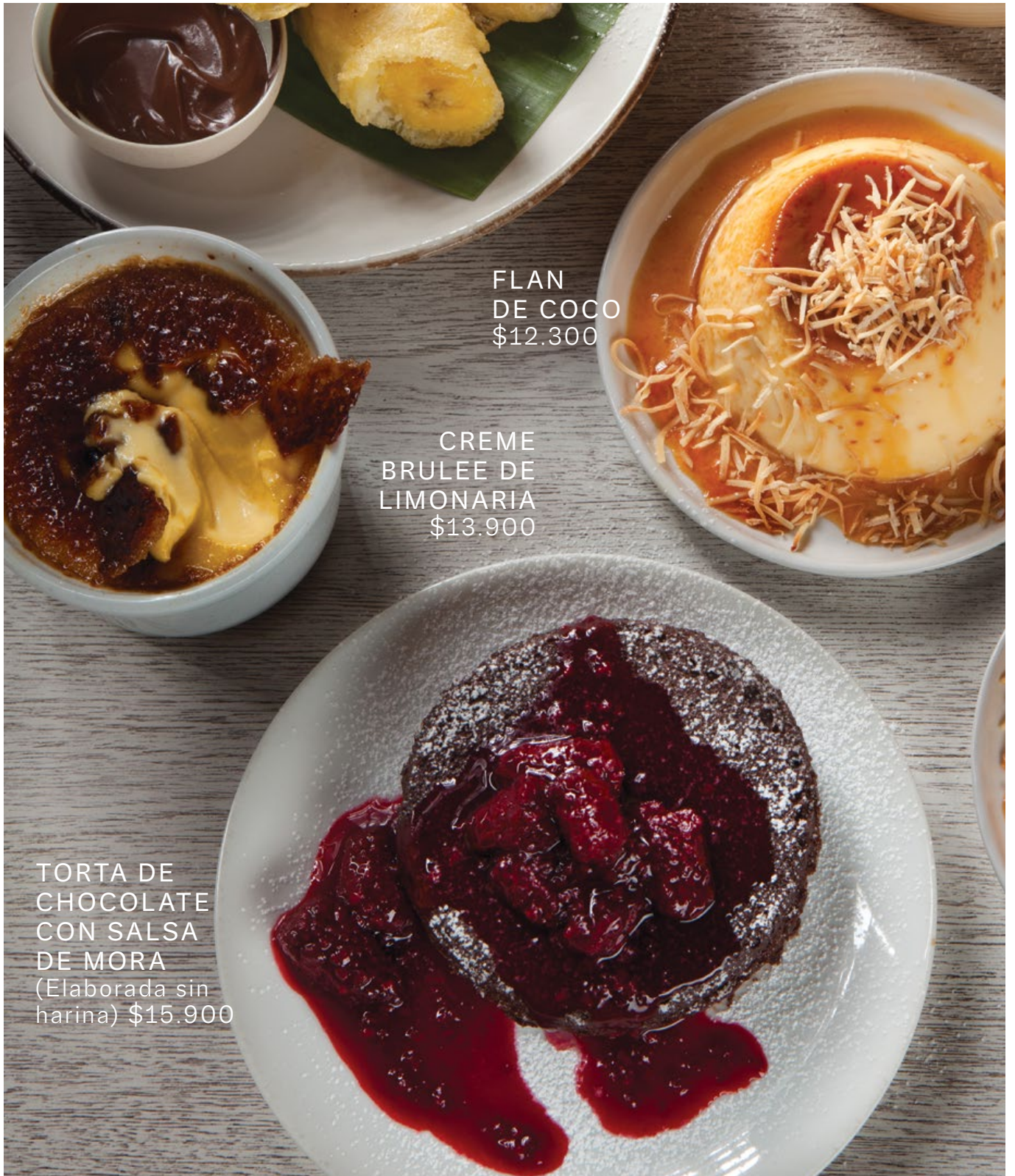
FLAN DE COCO $12.300