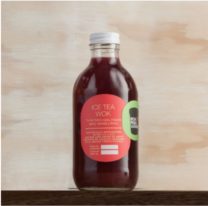
ICE TEA WOK Té de frutos rojos con infusión spicy, naranja y limón. $13.900