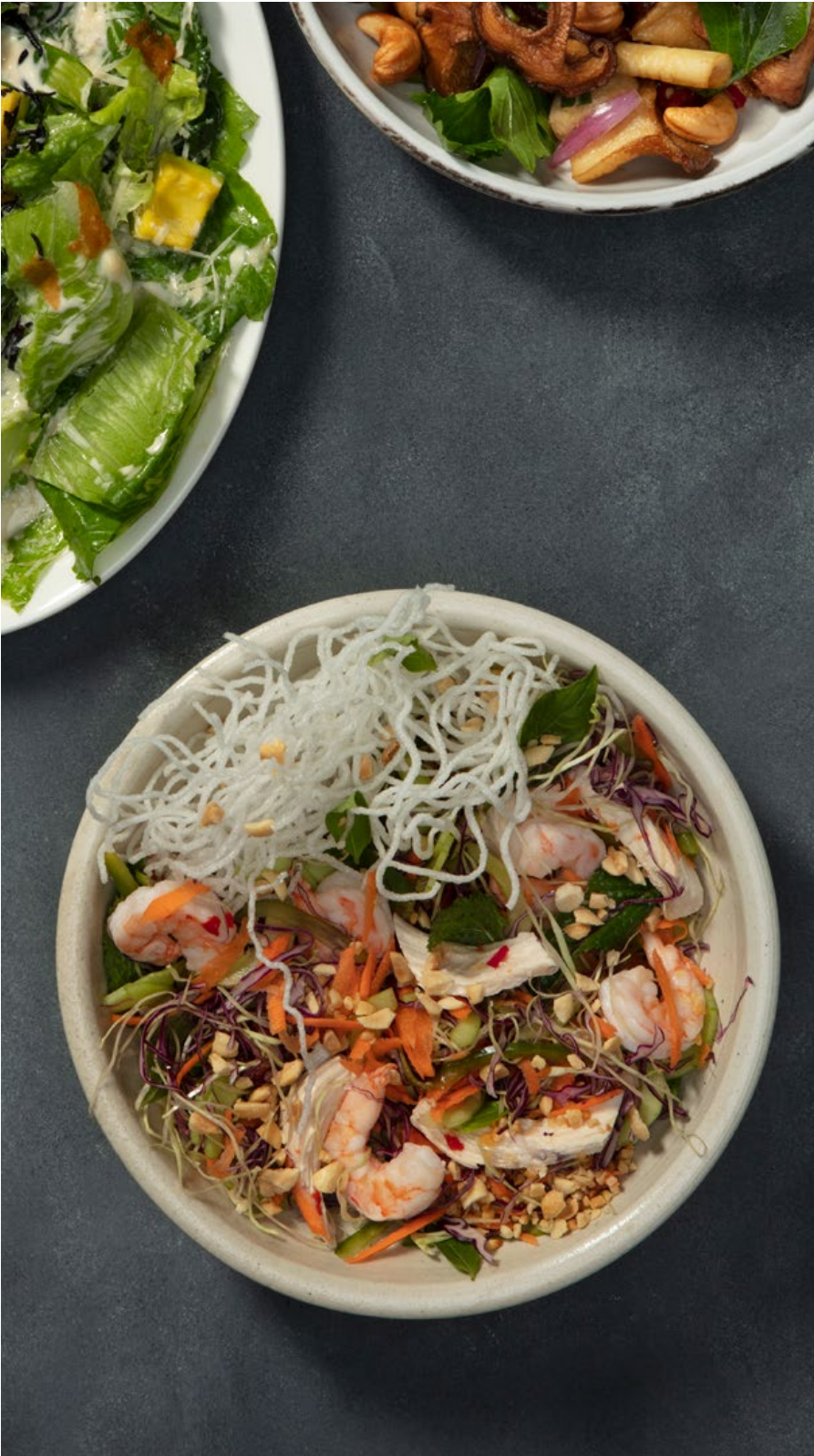
CRISPY NOODLES Camarones, pechuga de pollo, pasta vermicelli crocante, vegetales, albahaca siam, hierbabuena, maní y vinagreta vietnamita con chile y nam-pla. $36.900