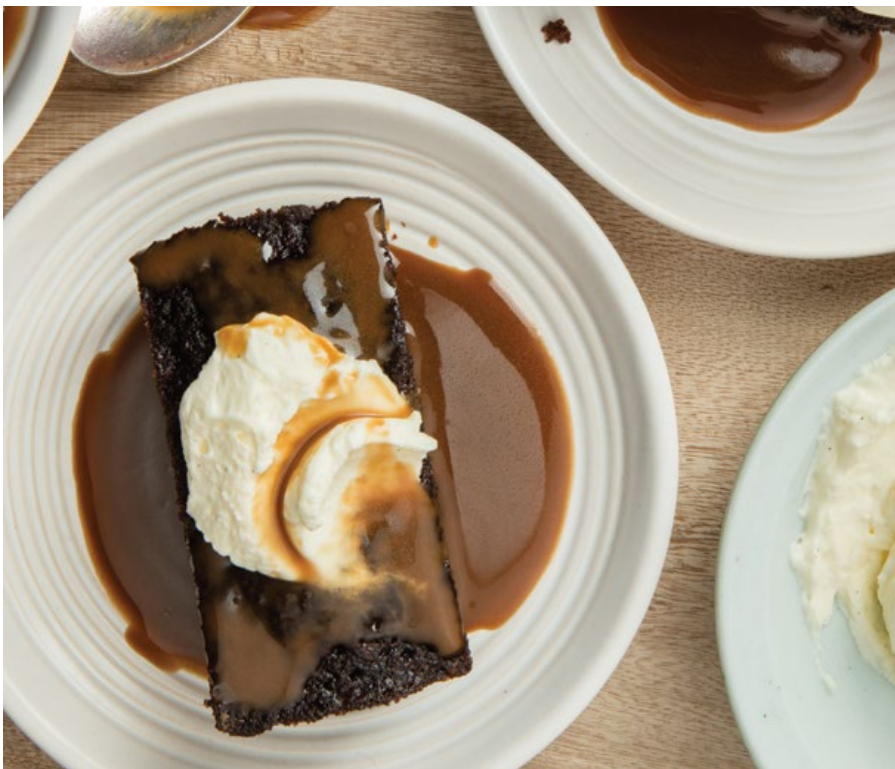
STICKY TOFFEE PUDDING Para calentar en casa $15.300