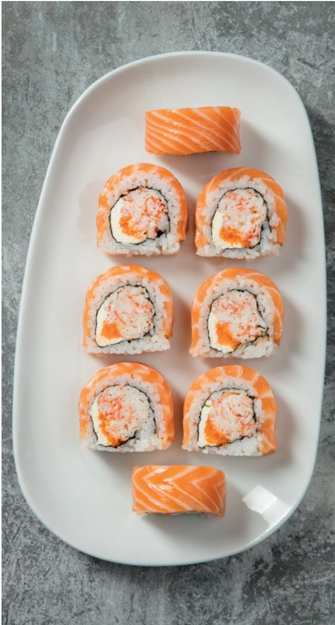
WOK MAKI SALMÓN 🍣 (8u) Palmito de cangrejo, queso crema y masago, envuelto en salmón. $38.900