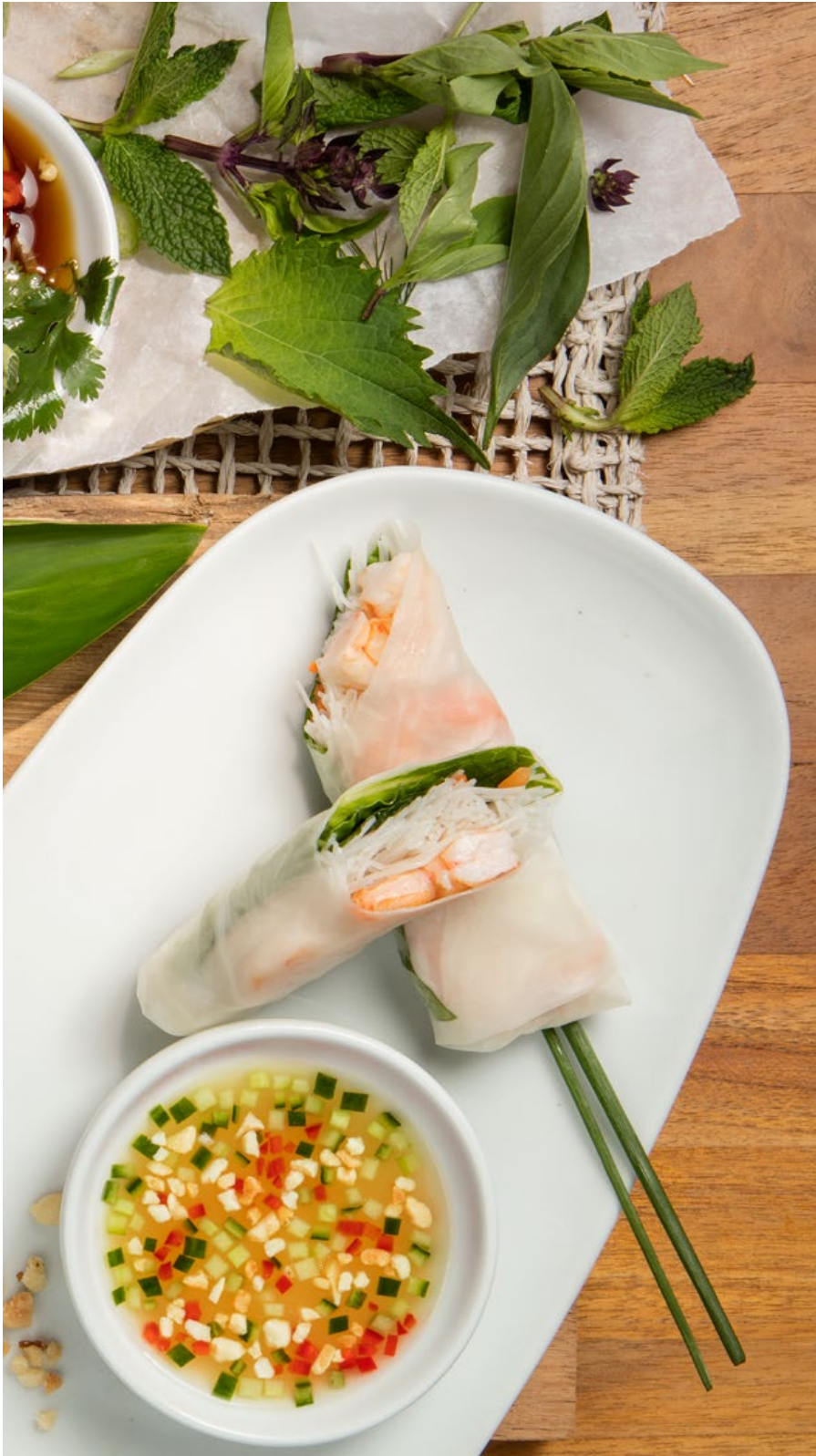
ROLLITOS DE PAPEL DE CAMARÓN (2 unidades) Camarones con pasta vermicelli de arroz, lechuga, hierbas y zanahoria. Servidos con salsa vietnamita con nam-pla y maní. $22.900