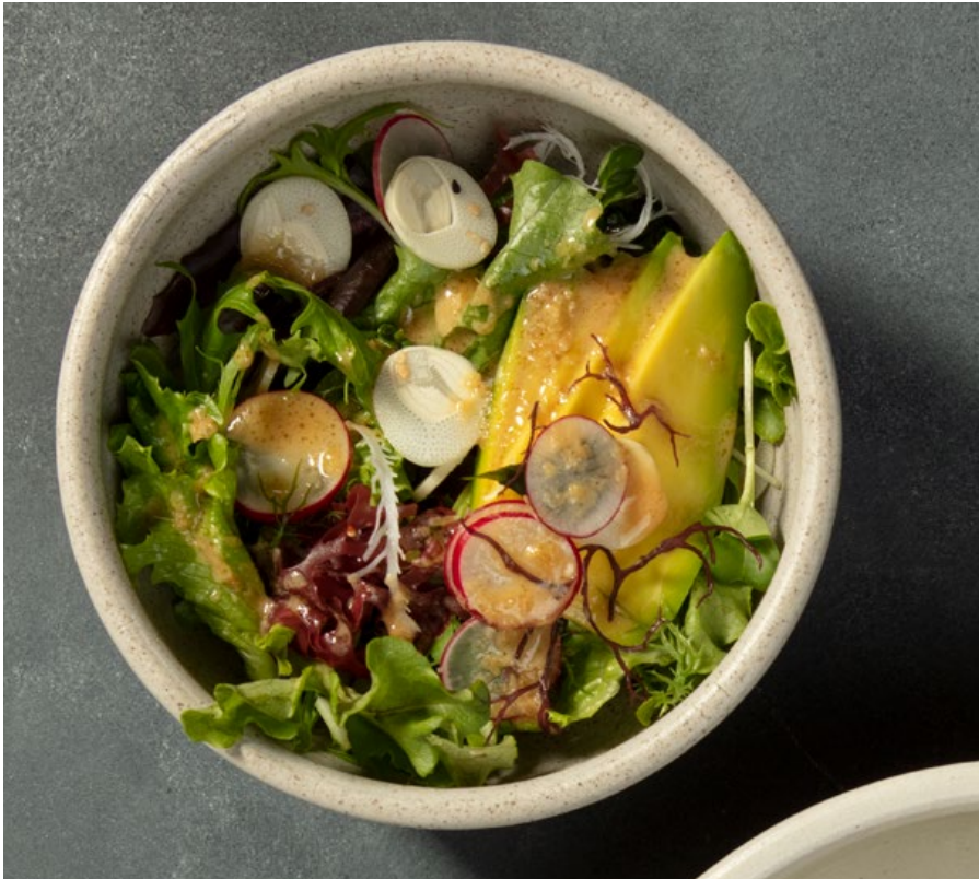
ENSALADA CON AGUACATE Y ALGAS Mezcla de lechugas orgánicas, aguacate, palmito del putumayo, ajonjolí, rábano y algas con vinagreta de jengibre. $22.900