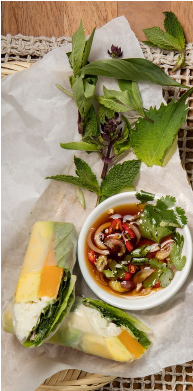
ROLLITOS DE PAPEL DE ARROZ DE VEGETALES Zapallo, lechuga, aguacate, jícama remoulade, mayonesa, germinados y salsa vietnamita a base de soya (sin nam-pla). $19.900